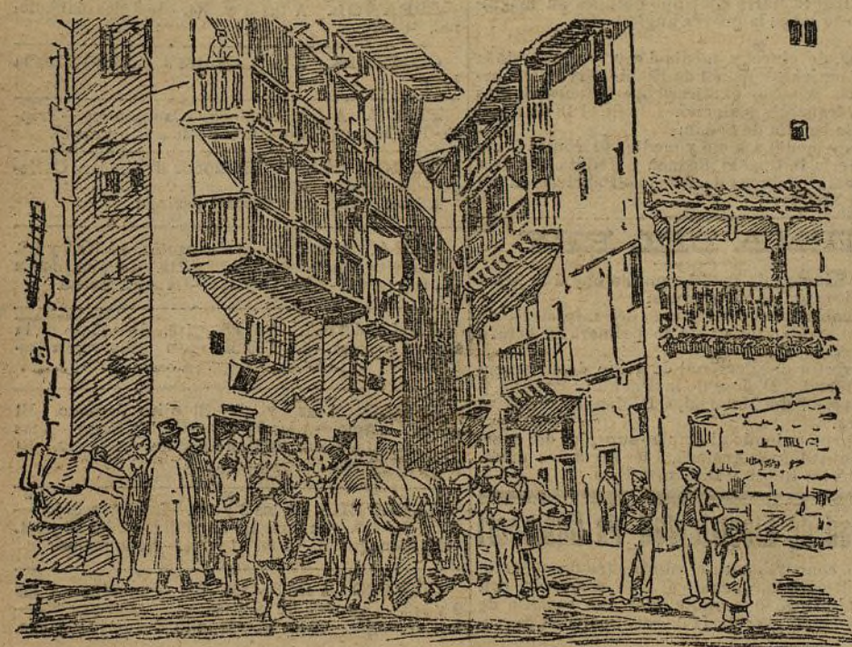
EN LA PLAZA DE ALBARRACÍN