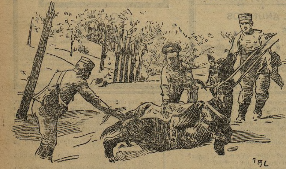
ENTRE NIEVE.—POR LA SIERRA DE VALDEMECA

Del discurso del Sr. Ibáñez Marín, que amablemente refiere ambas excursiones, deducen detalles curiosos, á partir del momento en que se organiza en Cuenca la primera parte de la expedición y su llegada á Valdemeca. Refiere de manera interesante cómo buscando el camino más corto á Fuente-García, origen del Tajo, salvan los montes de Valde-