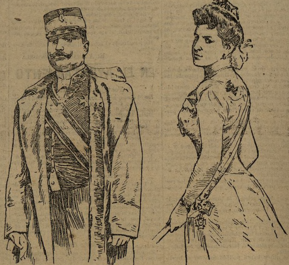
El barón y la baronesa de Wedel Jalsberg

Hoy ha presentado sus credenciales el nuevo representante de Suecia y Noruega en España.