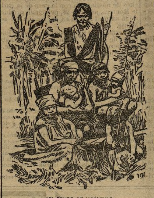
UN GRUPO DE INDÍGENAS

Actitud de Alemania.—Orígenes del conflicto sobre las riquezas de Venezuela, y Mr. Roosevelt ha abierto los ojos. El bombardeo que motiva estas líneas ha provocado la alarma de los círculos políticos norteamericanos. Invocando la doctrina de Monroe, se trata de no consentir a Alemania que continúe en su abuso de fuerza. Pero Alemania, llegada tarde al reparto del mundo, necesita colonias en que su población excesiva no se pierda, como se han perdido para el Imperio sus emigrantes a los Estados Unidos. Todo hace creer, por lo tanto, que si éstos han de mantener en lo sucesivo las doctrinas de Monroe, necesitarán apoyarse en una buena escuadra.