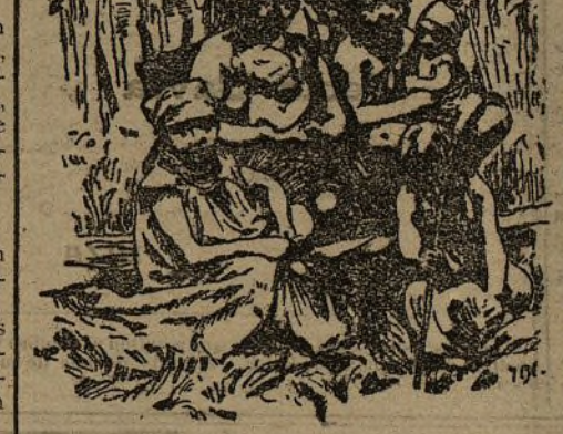
UN GRUPO DE INDIENAS

En el territorio comprendido entre los Andes y la costa se producen todas las plantas tropicales y europeas; en el centro, entre los Andes y la orilla izquierda del Orinoco, se tienden las sabanas que ofrecen al ganado praderas ilimitadas; en el Sud, hay cientos de leguas de bosques de caucho; el producto de más porvenir gracias al progreso.