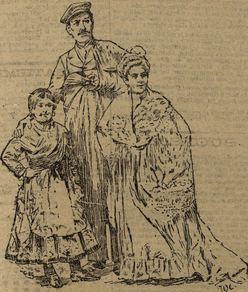
EL AUTOR DEL CRIMEN Y SUS DOS MUJAS (De una fotografía de C. Guitierrez).

El zapatero seguía en el calabozo de la Prevención en estado excitadísimo. El Sr. Puga, acompañado del inspector señor Sánchez Gómez, practicaron un detenido reconocimiento en la casa del crimen.