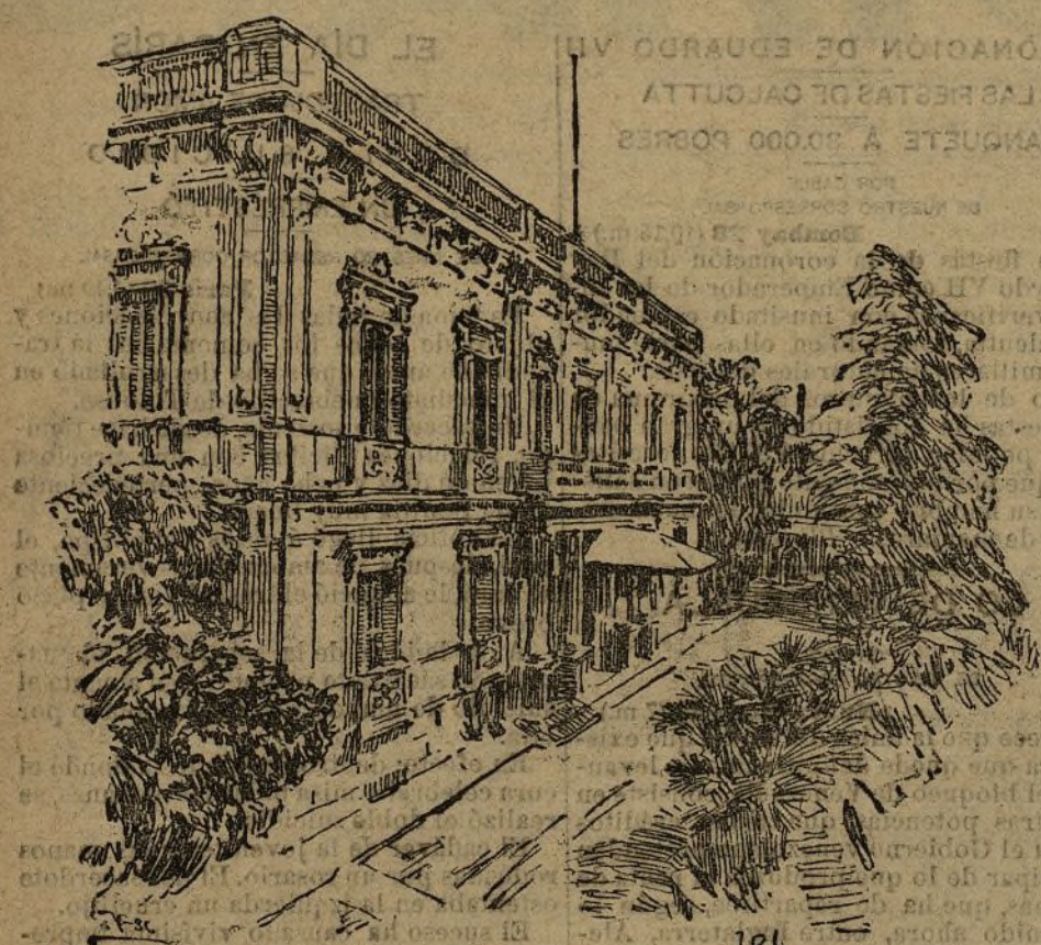
EL PALACIO DE LA EMBAJADA