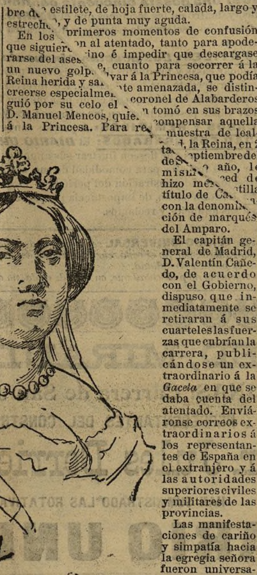
LA REINA ISABEL EN 1852

Vivia pobremente, sin familia, en compañía de una criada, en una humilde habitación de la casa núm. 2 del callejón del Inferno, hoy día de Julio. Religioso profeso de la Orden de San Francisco en el convento de Nalda, provincia de Logroño, se fugó de éste, firmando en el partido de ideas más avanzadas, emigrando a Francia en 1823, para evitar la vuelta al convento. En Francia consiguió la tenencia de cura de un pueblo inmediato a Burdeos, donde permaneció hasta que, restablecidas las instituciones liberales en España el año 1834, pudo volver a la patria. Su primer pensamiento, según el mismo manifestó, había sido matar a la Reina. Cristina es-