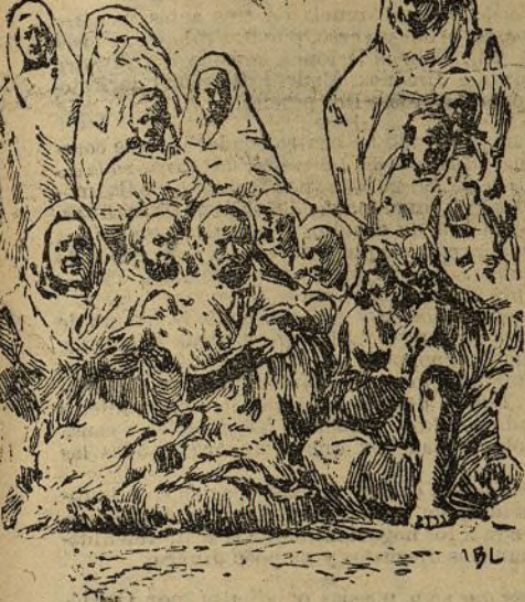
ESPERANDO EL PASO DEL SOBERANO

Yo creo que esos europeos siguen tranquilamente en Fez, a pesar de los viajes de los periódicos, porque realmente no se tiene noticia de que hayan llegado a ninguna parte.