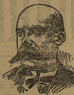
MINISTRO DE ESTADO

Los términos de este Mensaje, que en la tarde del 11 de Febrero fue leído a los representantes del país en el Congreso de los Diputados, son el mejor elogio que de la lealtad del Rey y de la nobleza de sus sentimientos puede hacerse.