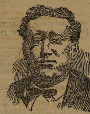
PRESIDENTE DEL CONGRESO

posición, suscrita por radicales y republicanos; aprobada ésta, se acordó lo siguiente: La Asamblea nacional reanuda todos los poderes y declara, como forma de Gobierno de la Nación, la República, dejando su organización a las Cortes Constituyentes. Se procederá, desde luego al nombramiento directo de un Poder ejecutivo, que será amovible y responsable ante las Cortes.