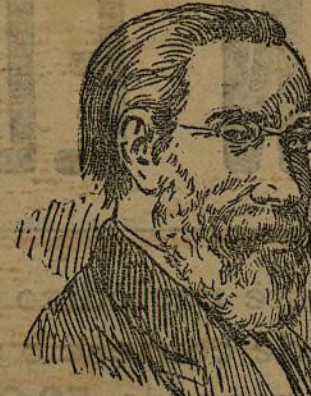
MINISTRO DE LA GOBERNACIÓN

El Gobierno de D. Amadeo tardó en llegar aquel día al Parlamento; esperaba que el Rey modificara sus propósitos. El Sr. Figueras pidió la palabra en aquella sesión para que D. FRANCISCO FIMARGALL