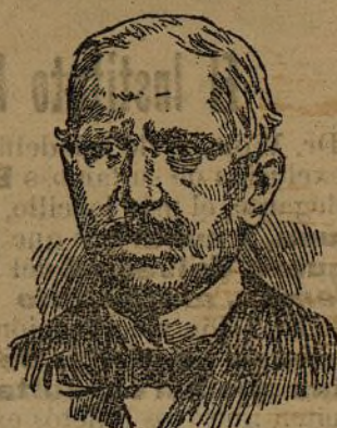
PRESIDENTE DEL PODER EJECUTIVO

El decreto de disolución del cuerpo de Artillería, que no obstante las observaciones en contrario que mereció al Monarca, hizo que la medida, el Soberano llamó al presidente del Consejo y le expuso su propósito irrevocable de renunciar al Trono. Trató D. Manuel Ruiz Zorrilla de disuadir al Rey de aquella idea, pero no pudo conseguirlo y tuvo que aceptar el Mensaje que, dirigido a las Cortes, le entregó el Monarca, en el que explicaba los motivos que le habían obligado a adoptar aquella resolución.