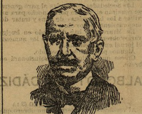
PRESIDENTE DEL PODER EJECUTIVO

El decreto de disolución del cuerpo de Artillería, que no obstante las observaciones en contrario que mereció al Monarca, hizo caso de Gobierno, fué la gota que colmó la medida. El Soberano llamó al presidente del Consejo y le expuso su propósito irrevocable de renunciar al Trono. Trató D. Manuel Ruiz Zorrilla de disuadir al Rey de aquella idea, pero no pudo conseguirlo y tuvo que aceptar el Mensaje que, dirigido a las Cortes, le entregó el Monarca, en el que explicaba los motivos que le habían obligado a adoptar aquella resolución.