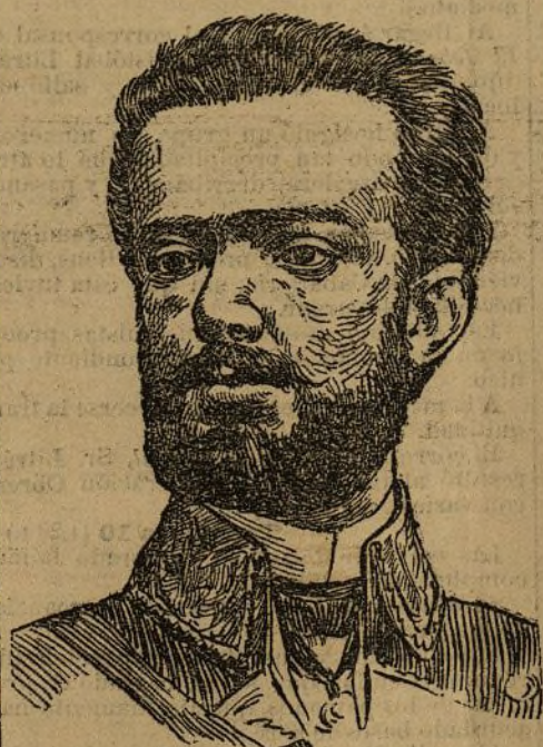
EL REY DON AMADEO DE SABOYA

Abdicación de Don Amadeo de Saboya.—Proclamación de la República en España