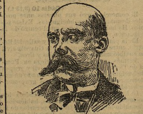
MINISTRO DE ESTADO

Los términos de este Mensaje, que en la tarde del 11 de Febrero fué leído a los representantes del país en el Congreso de los Diputados, son el mejor elogio que de la lealtad del Rey y de la nobleza de sus sentimientos puede hacerse.