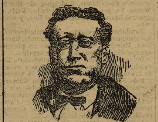
PRESIDENTE DEL CONGRESO

posición, suscrita por radicales y republicanos; aprobada ésta, se acordó lo siguiente: La Asamblea nacional reanuda todos los poderes y declara, como forma de Gobierno de la Nación, la República, dejando su organización a las Cortes Constituyentes. Se procederá, desde luego al nombramiento directo de un Poder ejecutivo, que será amovible y responsable ante las Cortes.