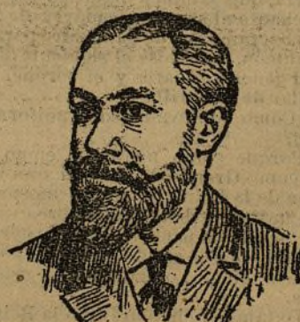
PERITO MÉDICO DE LA ACUSACIÓN PRIVADA