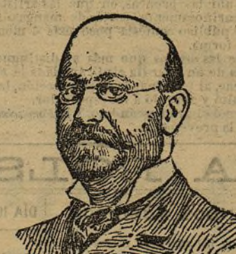
PERITO MÉDICO DE LA ACUSACIÓN PRIVADA

Y el presidente hace salir de la sala al