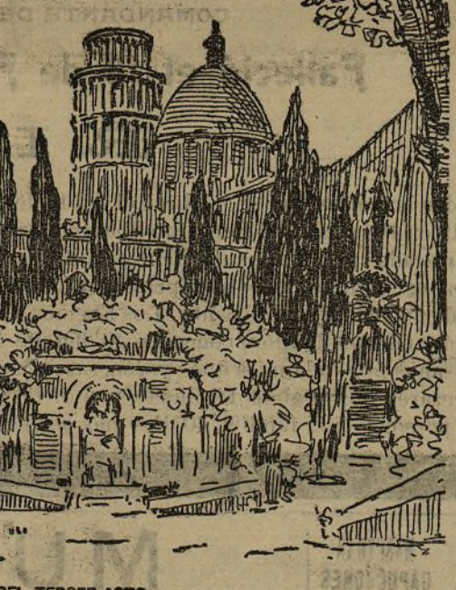
DECORACIÓN DEL TERCER ACTO

Vése en el fondo la famosa iglesia, el palacio de los Dux y los pintorescos edificios que forman la plaza. Una vistosa iluminación, que refleja y multiplica en las aguas del canal, adorna todos los edificios, prestando al conjunto un aspecto tan fantástico como brillante, al cual contribuyen los vistosos trajes de los enmascarados, damas, caballeros, soldados y gente del pueblo que en el desarrollo de la acción intervienen.