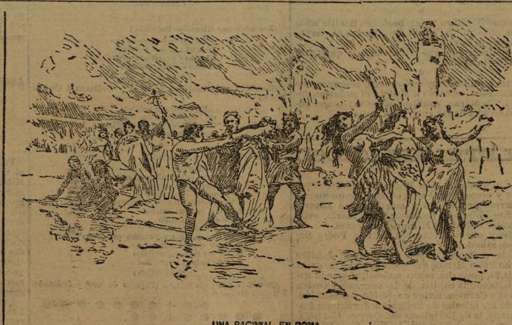
UNA BACNAL EN ROMA

Las fiestas del Carnaval están íntimamente relacionadas con aquellos regocijos paganos y de ellos se derivan. En todos los pueblos y en todas las épocas observan la analogía que existe entre aquellas fiestas antiguas y los re-