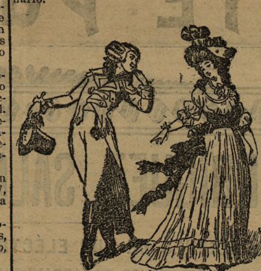
PRINCIPIOS DEL SIGLO PASADO EN FRANCIA

Desde que Madrid fué declarado corte, el Carnaval ha tenido en ella espléndido escenario.