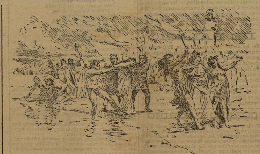
UNA BACANAL EN ROMA

Las luperales en que se festejaba al dios Pan, celebrábase el 15 de las calendas de Marzo, y ofrecían un carácter de marcada disipación. En ellas tomaban parte, no solamente la juventud, sino también los magistrados y sacerdotes; los desórdenes a que dieron lugar hicieron que se suprimiesen, para ser restablecidos años después por el emperador Augusto, hasta el siglo VI de nuestra Era, en que definitivamente quedaron abolidas.