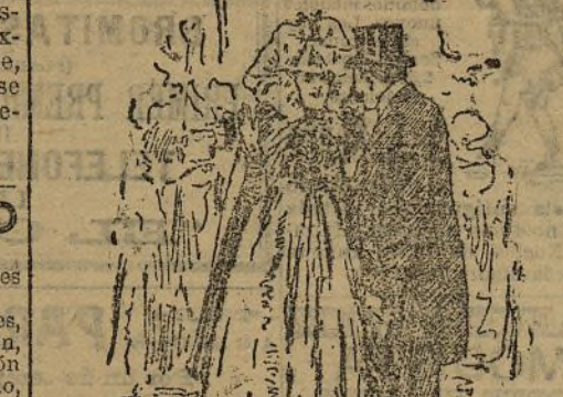
—¿Conque tomaría usted café?

Cierto que la mayoría de las máscaras le toma el pelo. Pero ¿el que la sigue la mata, y á lo mejor «salta» una patrona disfrazada, dispuesta a convencerlo.