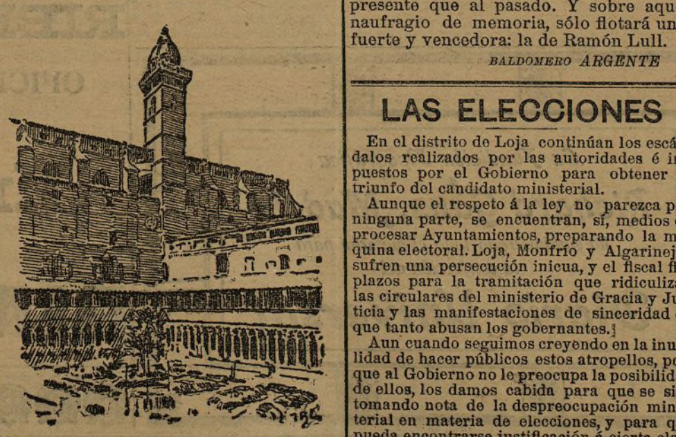
EL PATIO DE SAN FRANCISCO

El Lulio navega por el centro, a corto andar. Dos horas tarda en recorrer las nueve millas que median desde la boca al puerto. El día llega mansamente iluminando el espacio. A la izquierda se alza, sobre un collado, Bellver, gótico castillo que Jaime II de Mallorca hizo levantar en 1309 para defensa de la isla y recreo de su casa juntamente. Envuelto hasta ahogar, con oleaje inmóvil, el pardo tono de los pinabates y el recio verdor de los aloebechos con lozana frondosidad que oculta la tierra, y baja por un lado a bañarse en el mar, y se extiende, por otro, hasta Palma. Enfrente, la ciudad parece que, escapando del mar, invade las rocas y trepa por empinadas colinas, y enarceima su caserío en apretados hachos como un asustado aprieto que huye. A la derecha, la costa es baja y dispuesta a dejar paso al día. El alba acarmina el cielo por Oriente y esparce sobre el paisaje la claridad matinal.