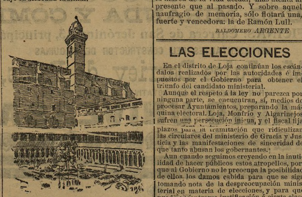
EL PATIO DE SAN FRANCISCO

El Lulio navega por el centro, a corta ancha. Dos horas tarda en recorrer las nueve millas que median desde la boca al puerto. El día llega mansamente iluminando el espacio. A la izquierda se alza, sobre un collado, Bellver, gótico castillo que Jaime II de Mallorca hizo levantar en 1309 para defensa de la isla y recreo de su casa juntamente. Envuélvenlo hasta ahogar, con oleaje inmóvil, el pardo tono de los pinabates y el recio verdor de los acebuches con lozana frondosidad que oculta la tierra, y baja por un lado a bañarse en el mar, y se extiende, por otro, hasta Palma. Enfrente, la ciudad parda, que, escapando del mar, invade las rocas y trepa por empinadas colinas, y enracina su caserío en apretados haces como un asustado aprieto que huye. A la derecha, la costa es baja y dispuesta a dejar paso al día. El alba acarmina el cielo por Oriente y espasea sobre el paisaje la claridad matinal.