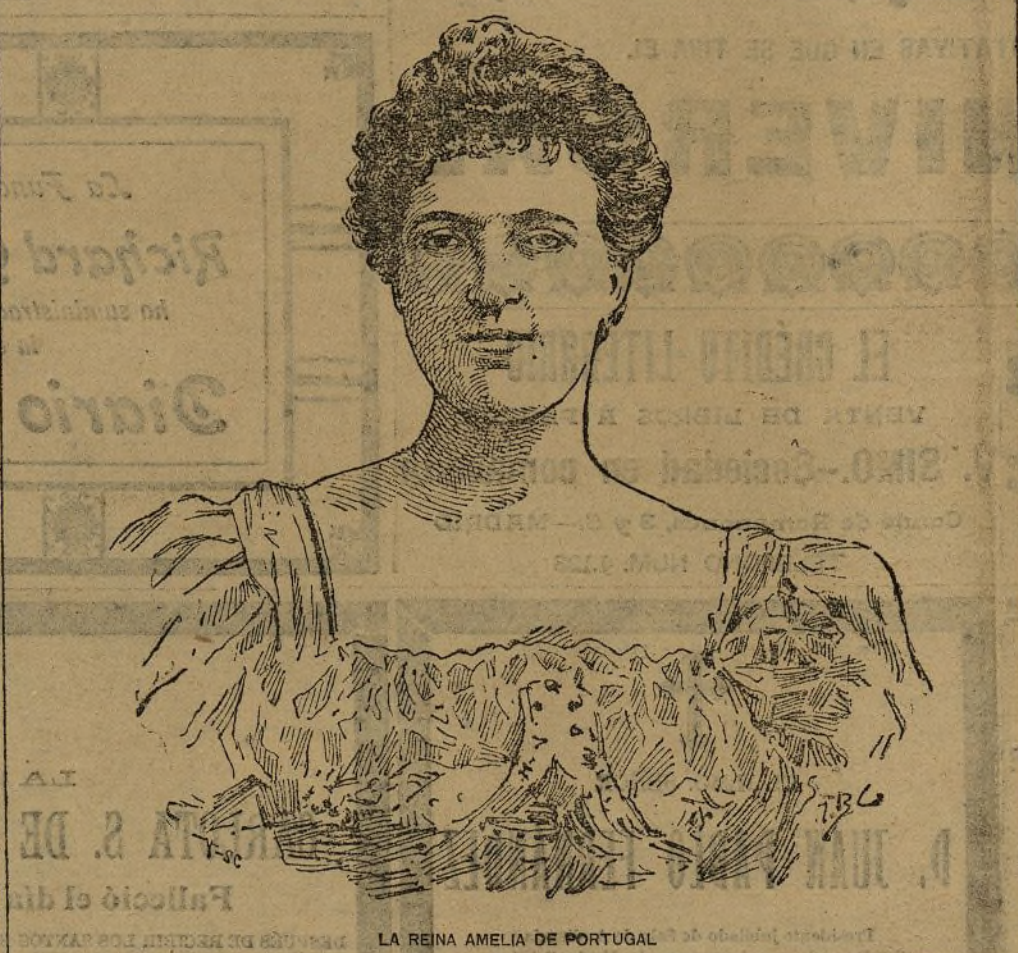
LA REINA AMELIA DE PORTUGAL