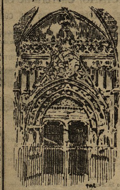
UN DETALLE DE LA CATEDRAL

bañarse en una ola de ambiente africano. Renace la sugestión árabe ejercida por el trazado de la población; por la arquitectura de los edificios; por el oír constante de palabras como Beniatzar, Benicavell, Beniforani, Benisalem, Beniali, nombres de sonantes parajes mallorquines; por la vestidura morisca de las mujeres tocadas con el rebecillo; por el suave acento del habla lemosina insinuante y dulce; por el ambiente caldeado y aromoso. Y la fantasía se traslada á aquellos siglos medievales en que el espíritu soñaba adormecido.