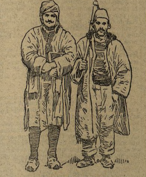
ALDEANOS DE MONASTIR

Creemos, por lo tanto, de algún interés de