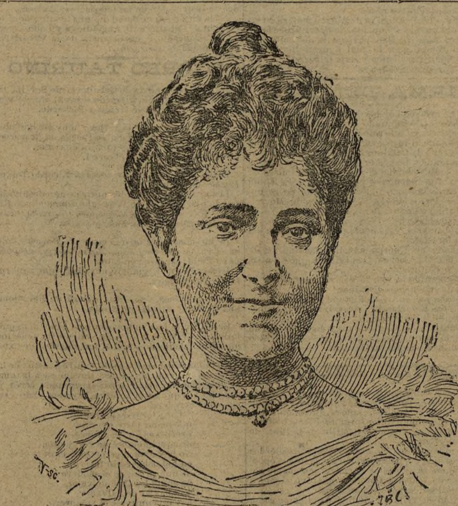
S. A. LA PRINCESA DE ASTURIAS ha dado á luz un niño infante á las cuatro de la tarde. Véase en la tercera plana nuestra información de Palacio.

Durante una operación quirúrgica hizo proyectar sobre el enfermo un haz de rayos de luz eléctrica azul.