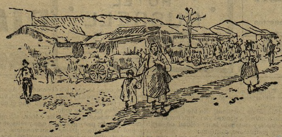
UNA ALDEA BÚLGARA

Y del mismo modo los búlgaros-macedonios, cuando comparan su vida miserable con la situación relativamente feliz de los búlgaros libres, aborrecen más y más a los mahometanos, que, desde hace siglos, les oprimen, explotan y envilecen, imponiéndoles una implacable servidumbre. Una inmensa conspiración ha ganado poco a poco toda la Macedonia, y a partir de 1896 al año actual, Comités secretos se han formado en todas las poblaciones para propagar las ideas de independencia.