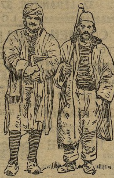
ALDEANOS DE MONASTIR

La mayoría de la población macedonia es cristiana y de sangre búlgara. Habla la misma lengua, tiene idéntica religión e iguales aspiraciones que los habitantes del principado de Bulgaria, creado en 1878 por el Congreso de Berlín a consecuencia de la guerra ruso-turca. Desde su emancipación,