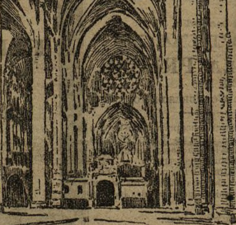
DETALLE DE LA CATEDRAL DE PALMA