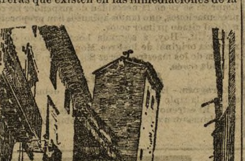
Iglesia de San Pedro, cuya torre tiene una inclinación de 1,27 metros.

El ensanche de la estación del ferrocarril, incapaz para el movimiento de aquella población, es tan necesario como la carretera, y desde luego más urgente. Consignando un solo detalle se comprenderá lo razonable de la petición. Únicamente las dos fábricas azucareras que existen en las inmediaciones de la