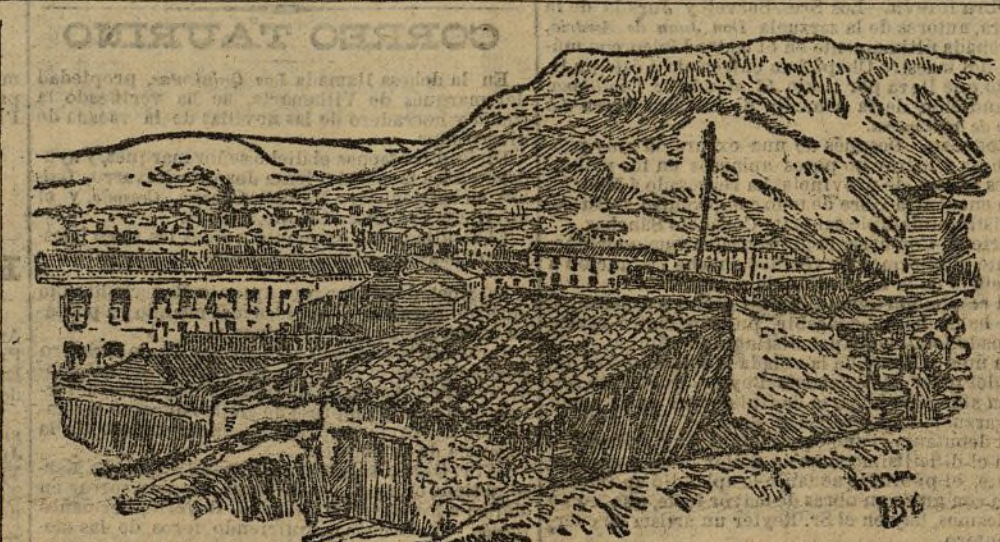
Cerro de la Muela, cuyos desprendimientos amenazan a la población que vive en sus estribaciones