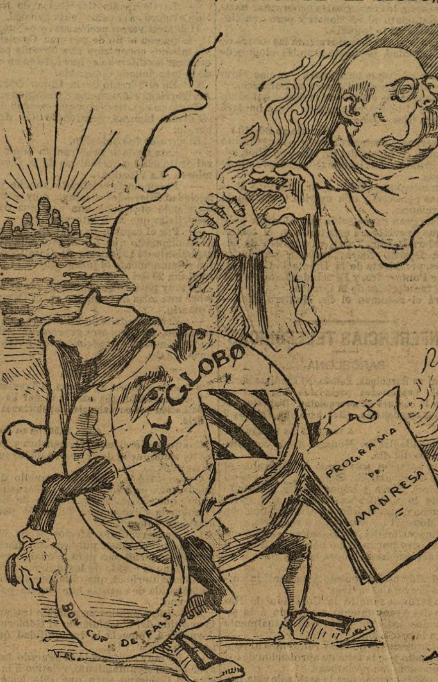
Lo que es ahora no lo conocerá ni la madre que lo parió.