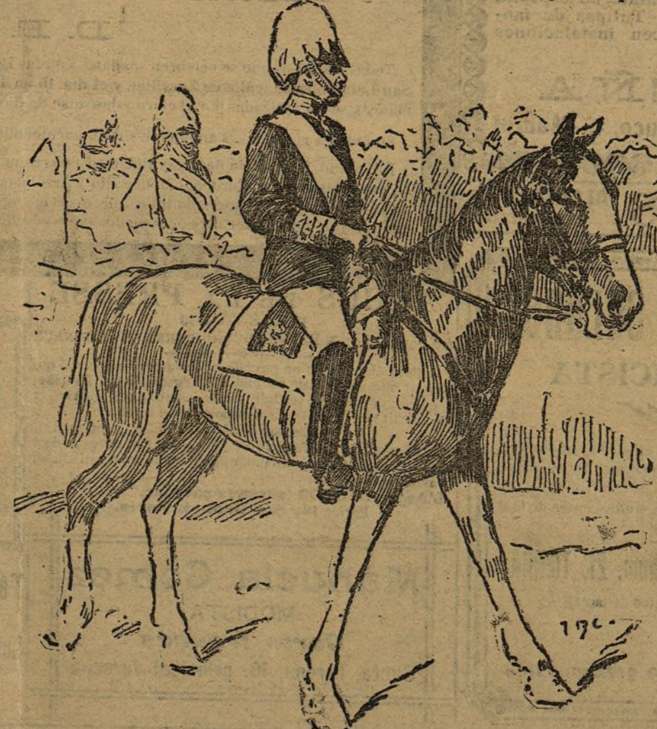
S. M. en el acto de la jura

Momentos después, el jefe del Gobierno, señor Silvela, vestido con el uniforme de consejero de la Corona, apareció al frente de sus compañeros de Gabinete, que también vestían de uniforme, los Sres. Dato, Aliende-salazar, Sánchez de Toca, marqués del Vadi-