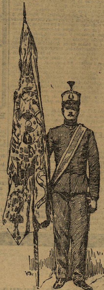
Abanderado del regimiento del Rey, con el pendón de Castilla

Con el ceremonial reseñado por nosotros anoche y con la solemnidad y animación que también precedieron, se ha verificado a las diez de esta mañana el solemne acto de jurar