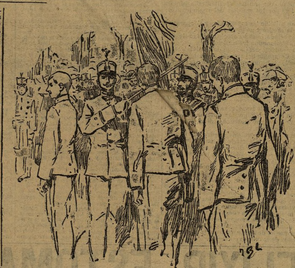
El acto de protección

Y, en efecto, D. Alfonso, montando una pre-