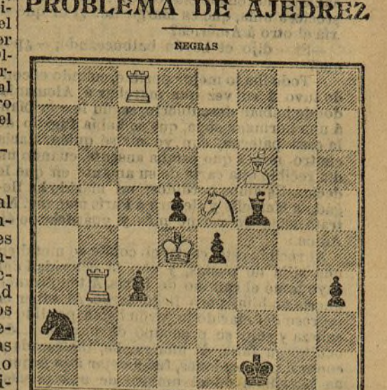
Juegan y dan mate en tres jugadas

Solución al del número anterior: Jugada clave: Torro a 7 de Reina.