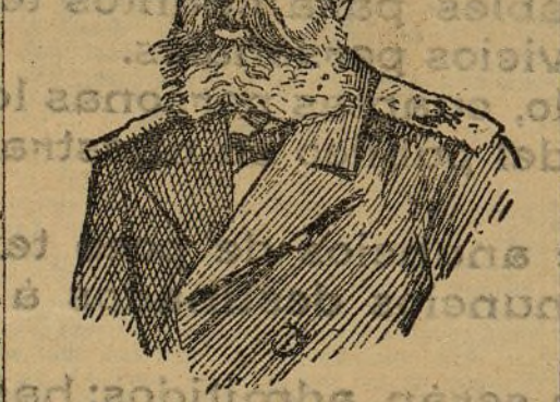
Nuevo ministro de Marina en Rusia.