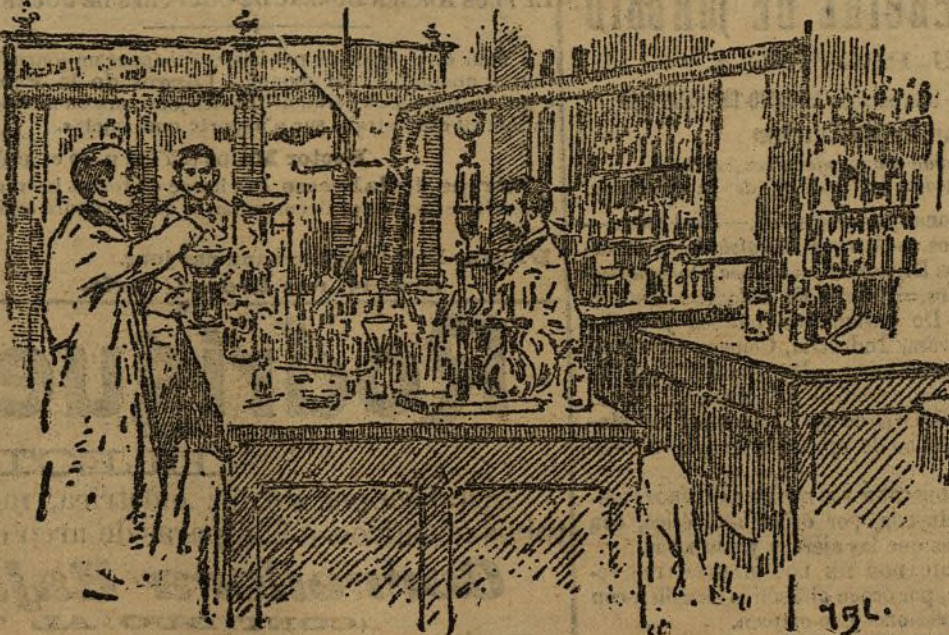
Sala del Laboratorio