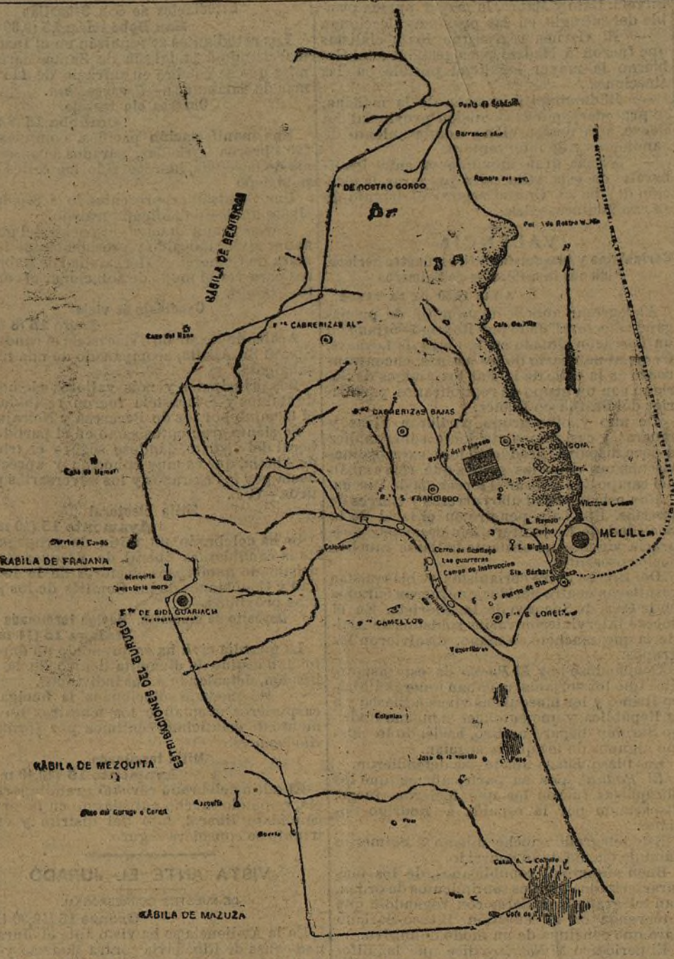
Plano del campo exterior de Melilla con una línea divisoria y la indicación del lugar en que se halla Frejuna.

Por Real orden se han declarado adecuadas las licencias, términos posesorios y sus prórrogas, otorgadas a los funcionarios de las carreras judicial y fiscal, así como las licencias de los notarios, disponiendo que todos ellos se encuentren sirviendo sus respectivos cargos el día 20 del corriente mes, y que los presidentes de las Audiencias territoriales comuniquen al ministerio haberse cumplido lo que se dispone en la Real orden.