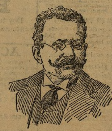
Doctor Cortezo Presidente

Se inaugurará el día 20 en el paraninfo de la Universidad Central