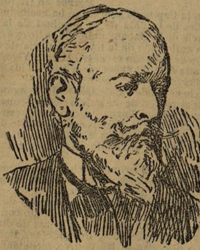
Marqués de Miraflores