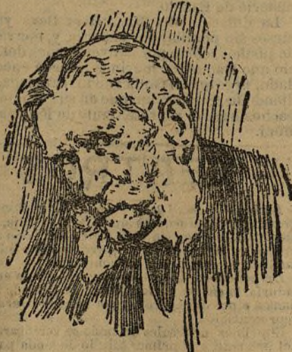
Marqués de la Vega de Armijo