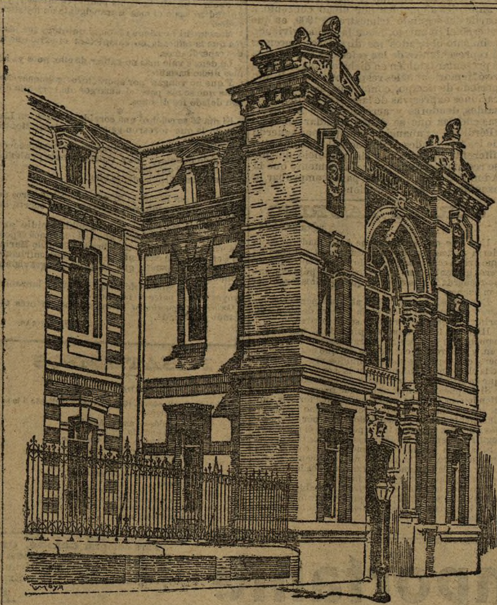
EL INSTITUTO OFTÁLMICO

La otra noche tocó la cuerda electoral... ¡Válgame el cielo y cómo puso su paternidad a los candidatos! Sin duda había algún interés en el almuerzo con que la generosidad del Sr. Maura en el Gobierno, en el ministerio de la Gobernación, ha cerrado todo camino. Su personalidad, símbolo un día de grandes esperanzas, que no justificaba, por cierto, su historia política, ha llegado a representar, al resumir la impotencia del partido en masa, Maura ha sido, por sí propio, el mayor disolvente. El ha deshecho las fuerzas conservadoras; él ha causado la ruina prematura