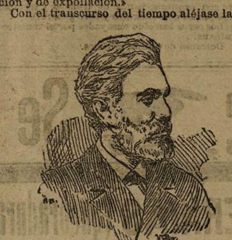
Rebel Jefe del socialismo alemán

Los mismos hombres de Estado como una manifestación del positivismo científico. No son únicamente obreros los que militan en esa marcha triunfal hacia la sociedad del porvenir. Sus adeptos se cuentan también en las llamadas clases directores, dándose el caso de que allí donde más desarrollada está la cultura, mayor incremento y mayor influencia tienen las nuevas ideas.