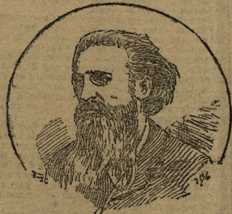
Guesde Jefe socialista francés