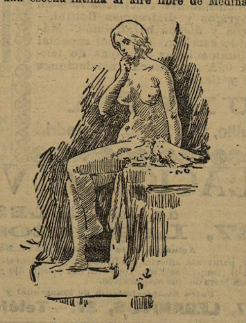
Revelación, por Alguero Nicolí

Dos notables desnudos de Martínez Ruiz, en que habiéndose propuesto el artista vencer dificultades de color, como las que representan la semejanza de tonos de las telas y las carnes, ha salido airoso de su empeño; también merece una mención especialísima el patio de Granada, del mismo autor, el cual hizo un apunte nuestro compañero Blanco Coris, que acompaña a estas líneas; dos bonitos paisajes de Carlota, en los que se observa un serio estudio de la Naturaleza; una escena íntima al aire libre de Medina