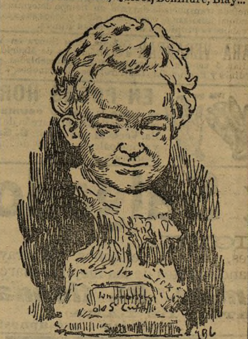
Un sobrino del cura, por F. Cabrera