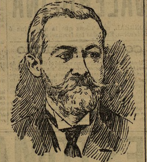
D. Gabino Bugallal Fiscal del Supremo