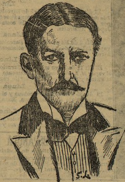
G. Wyndham, ministro del gabinete inglés, autor de la reforma agraria para Irlanda.

Nosotros, desde la independencia de nuestra situación, juzgamos que a esa minoría democrática le está reservada en las Cortes una misión de gran importancia. Por eso la estimulábamos, por eso la advertíamos de que no debe perder ni un día, ni una hora, ni un minuto. Quizá el país le ofrece una ocasión suprema y quizá esa ocasión, no se aprovechará, no vuelva nunca. Pero en nuestro artículo no había nada que autorizase a sospechar que nuestras advertencias y nuestros estímulos tendían al afianzamiento de un régimen infeudado de turnos que consideramos suicida; no había nada que permitiera suponer que aconsejábamos un status quo estéril y peligroso disfrazado con la máscara de ese gubernamentalismo con que se disimulan las codicias y las impaciencias. Si un periódico ministerial, comentando nuestras palabras, saca las conclusiones que tuvo por convenientes, claro es que suya, exclusivamente suya, será la responsabilidad de lo que escribe. Nuestro criterio era bien transparente. Divorciado de su tradición y rebelde a las exigencias de los tiempos, el partido liberal y la minoría que lo representa, no significará nada. Interprete el país que lo lleva a las Cortes, puede pesar mucho y cumplir una alta misión nacional.