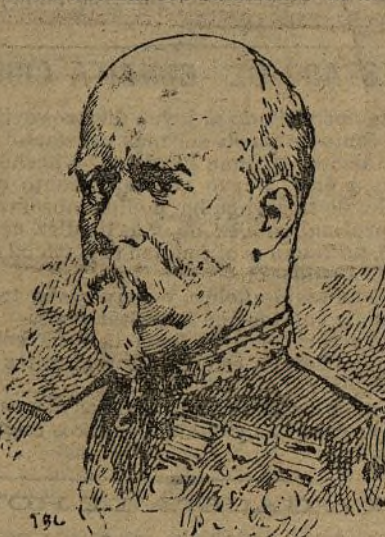
D. Marcelino Azorárraga Presidente del Senado.

Cubriendo la carrera ha habido las fuerzas siguientes: Los regimientos de Caballería del Rey y de Infantería de León. Estos ocupaban la parte de la derecha de la plaza de Oriente. Estaban además los batallones de Saboya,