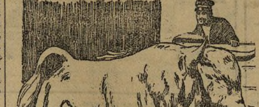
Cartel anunciador de la corrida de hoy en Aranjuez, pintado por Marcelino de Ureca

Subastas para conservación de carreteras.