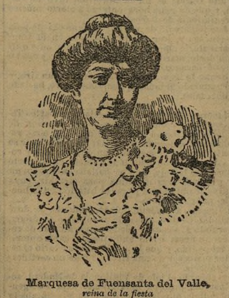
Marqués de Fuensanta del Valle, retiro de la fiesta