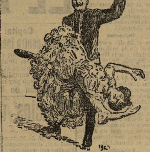
Los patinadores vascos, del Circo de París