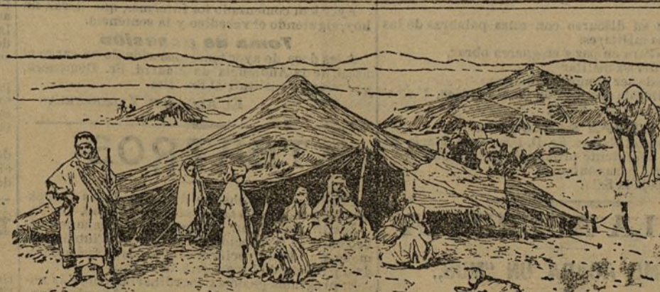
Un campamento de nómadas

Noticias hay que vale más no saberlas. ¿Qué estimo más: haber de tener ahora las innumerables chicas que gustan de componerse y afeitarse por el desdoro de degradarse?—Si sobran tantas—dirán,—¿para qué tomarnos esa molestia?