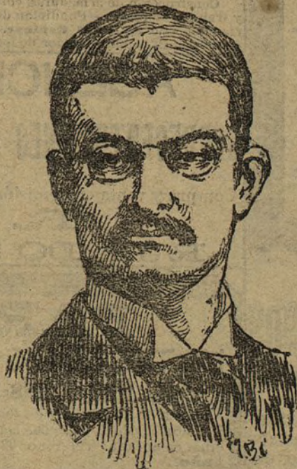
El rey Alejandro

La terrible escena no inspira piedad alguna.