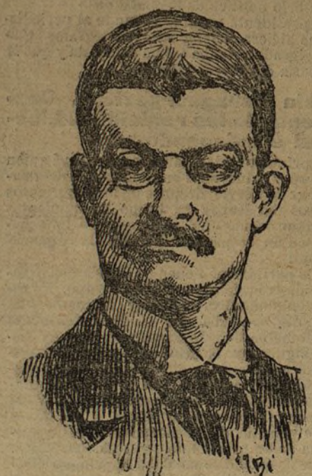
El rey Alejandro

El corresponsal de The Daily Mail ha hecho un minucioso relato de los sucesos ocurridos en Belgrado, en la forma siguiente: «Raunovitch abre por medio de una bomba explosiva la puerta de la regia estancia. Entrar en ésta con los revólvers en la