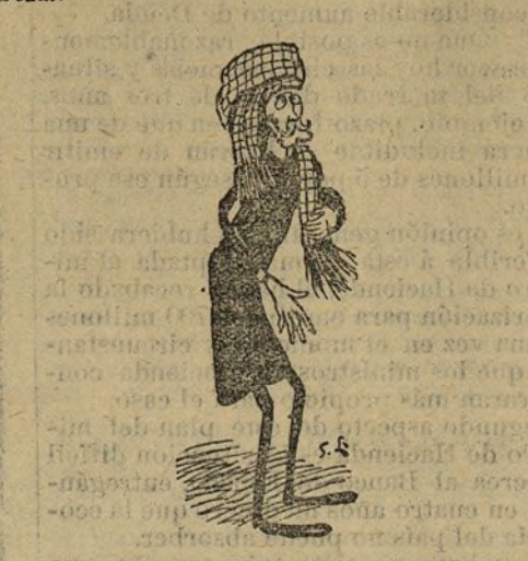
«El Cabo Finisterre y el Golfo de México están agitadosísimos».