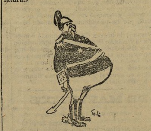
Y lo cierto es que el general, como ustedes podrán observar, aún no ha salido de su embarrado.

cuales no dará á luz hasta la próxima legislatura».