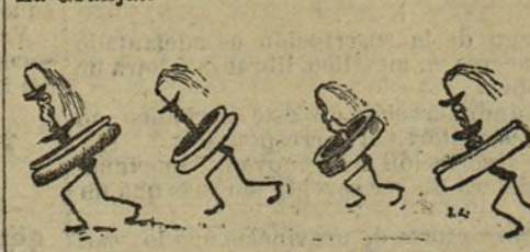
Pero esto no es nada para lo que publicó una vez cierto periódico:

«El general Falcón se encuentra embarrado por las muchas ocupaciones que le imponen el estudio de su plan de reformas, las