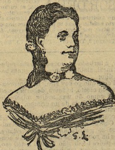
La bailarina Pepita Durán