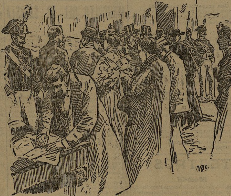
Firmando en la antecámara de Su Santidad después de leer el parte facultativo.