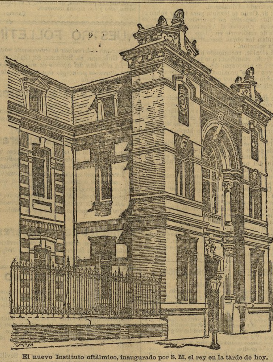
El nuevo Instituto oftálmico, inaugurado por S. M. el rey en la tarde de hoy.

Pero si las bebidas frías no son nocivas en la comida, lo son siempre fuera de ella, y tóxicas durante la digestión, pueden ocasionar la muerte. Los efectos de los helados son diferentes, según su composición. Los acidulados, como el limón, ananas, etc., perjudican generalmente a las personas predispuestas a la tos; pero se evita