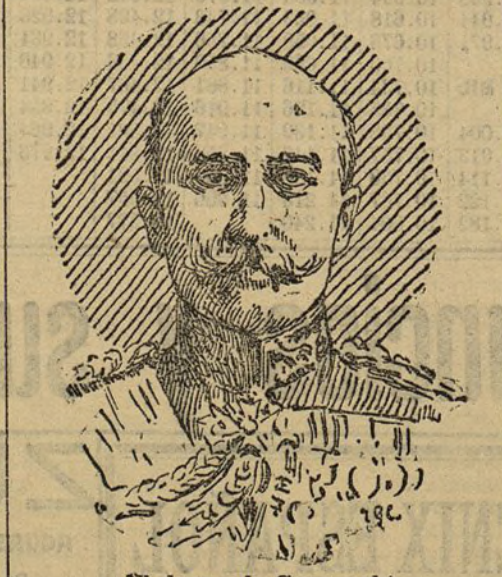
El duque de Connaught, que ha despedido a M. Loubet en nombre del rey de Inglaterra.

El emperador de Alemania recibió hace pocos días en su estudio de pintor a los enviados extraordinarios de Hungría, y les hizo revelación del pensamiento y los bocetos de dos importantes cuadros alegóricos que prepara para sorprender con ellos a la humanidad.