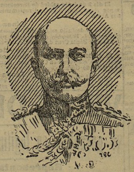
El duque de Connaught, que ha despedido a M. Loubet en nombre del rey de Inglaterra.

El emperador de Alemania recibió hace pocos días en su estudio de pintor a los enviados extraordinarios de Hungría, y les hizo revelación del pensamiento y los bocetos de dos importantes cuadros alegóricos que prepara para sorprender con ellos a la humanidad.