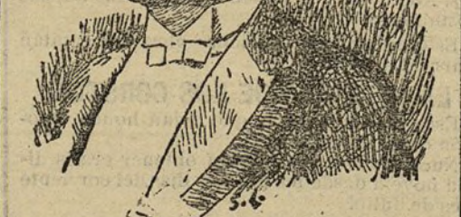
D. Manuel Estrada Cabrera, Presidente de la República de Guatemala.

«Ay, los dioses han puesto en la boca de los siglos una voz doliente y gomebunda anunciando al mundo que el dios Pan había muerto, y con él los otros dioses. Y, sin embargo, la esencia de aquella poderosa civilización helénica vive y subsiste. Minerva es un símbolo