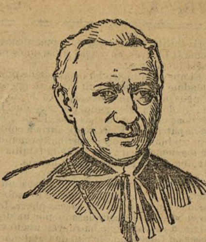
CARDENAL DI PIETRO