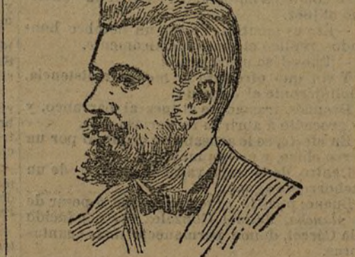
Don Santiago Alba Nuevo subsecretario de la Presidencia del Consejo de ministros.

Rostand ha sido implaceable con aquel pecado de su juventud, si es que en realidad fué pecado, y ha hecho mal; la juventud es demasiado rápida para que sea lícito desdorar sus recuerdos, siempre gratos, aunque no sean tan gloriosos como los que Cyrano de Bergerac hará nacer.