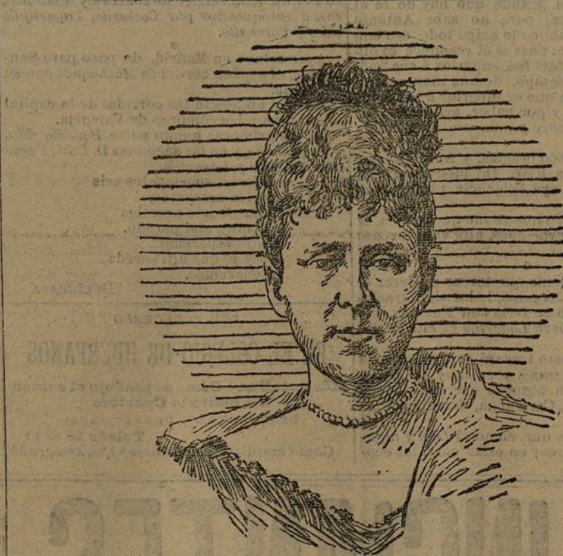
S. M. la Reina madre, que celebra hoy la festividad de su santo.

En el primer punto fija como ideal la adopción de la peseta oro como tipo. El artículo 1.º y el 2.º, consagrados a hacer esa declaración, son puramente platinos. Para obtenerlo, hay que comenzar por impedir el agio; el Sr. Villaverde crea una oficina reguladora del cambio, que comprará y venderá francos por cuenta del Tesoro. Y para proveer a esta oficina de francos y pueda vender—porque ó se somete a los tipos de la plaza, como ha