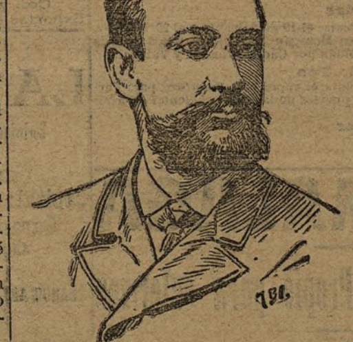
El príncipe de Monaco, que llegará un día de estos á San Sebastián, con objeto de saludar al rey.

Durante el pasado año de 1902 han sido perpetrados en un solo Estado de la Unión, 113 casos de lynchamiento.