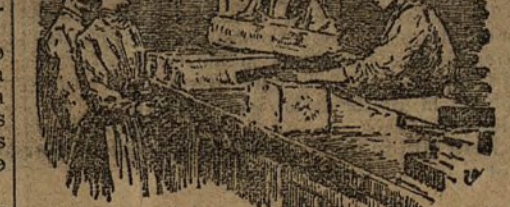
La venta al por menor

Cada 25 moldes permanecen veinticuatro horas sumergidos en el depósito. Pasado este tiempo, el agua se ha trocado en cristallino.