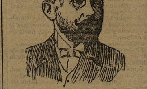
D. Eugenio Silveira, fiscal del Tribunal Supremo