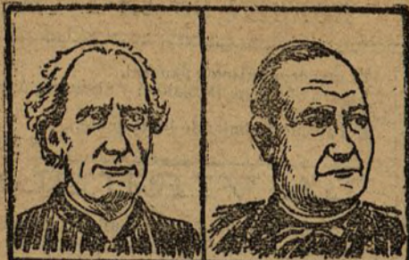
Cardenal Oreglia, italiano, nació en 1828.

Los cardenales del Sacro Colegio que mañana, á las cinco de la tarde, se instalarán en sus respectivas celdas del Vaticano para proceder á la elección del nuevo Papa.