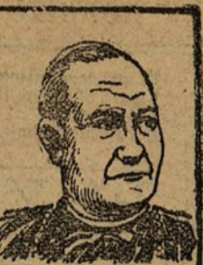
Cardenal Vannutelli, italiano, nació en 1834.