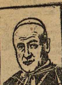
Cardenal Agliardi, italiano, nació en 1832.