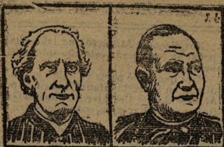
Cardenal Oreglia, italiano, nació en 1828. Cardenal Vannutelli, italiano, nació en 1834.

Los cardenales del Sacro Colegio que mañana, á las cinco de la tarde, se instalarán en sus respectivas celdas del Vaticano para proceder á la elección del nuevo Papa.