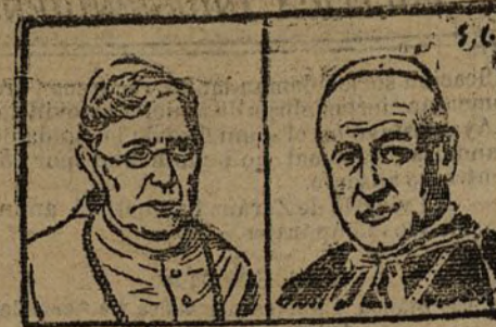
Cardenal Mocenni, italiano, nació en 1823. Cardenal Agliardi, italiano, nació en 1832.