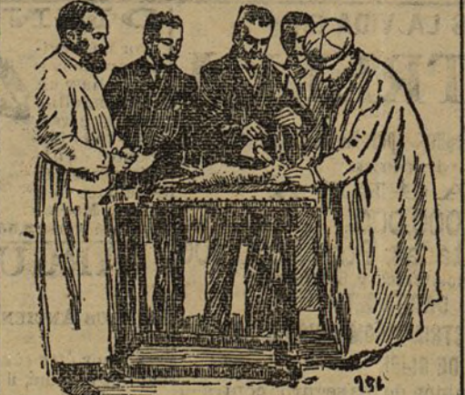
Trepanación de un conejo para revelar la rabia

Parece mentira que esto ocurra en la capital de España. Se comprende que todavía crean en saluadores los pobres aldeanos ignorantes de los descubrimientos que hace la