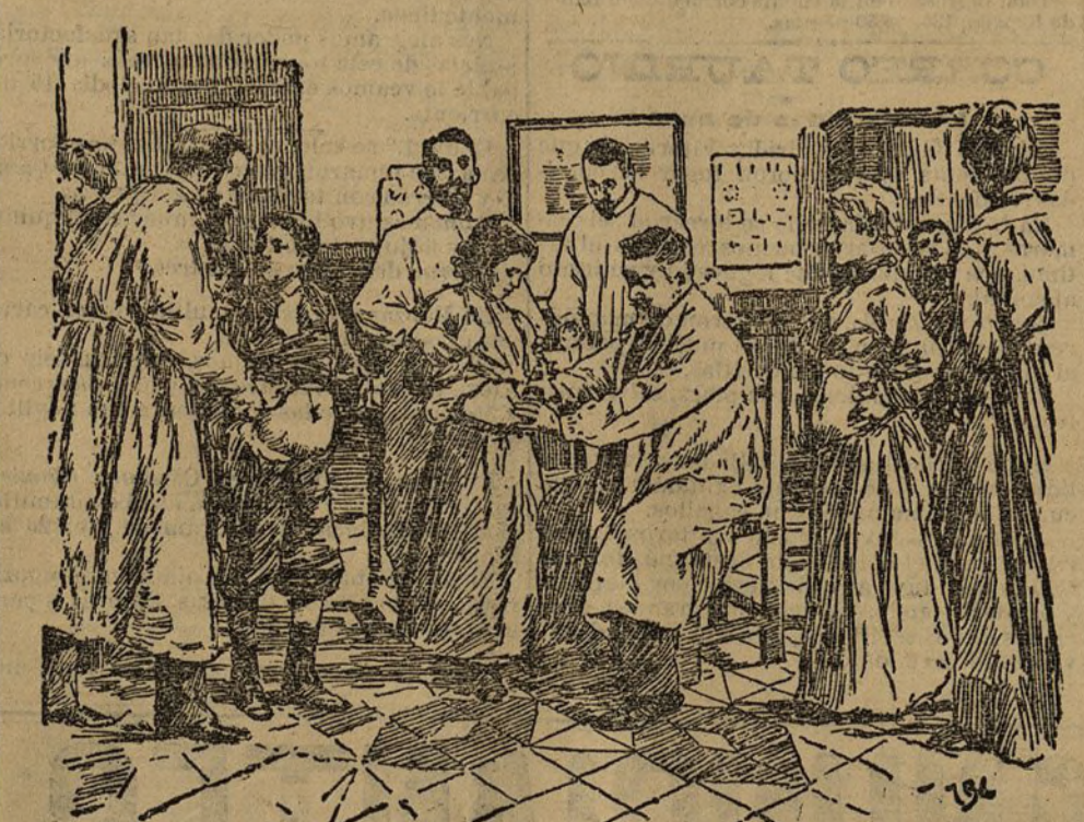
El director del Instituto poniendo inyecciones antirrábicas

Una visita al Instituto antirrábico. Luchas entre la superstición y la ciencia. Los saluadores. El primer caso de Pasteur. Aplicación del remedio en Madrid.